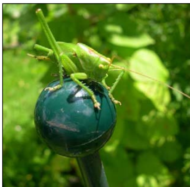
Nog een (bruin) exemplaar die we tegen kwamen tijdens onze vakantie in de Italiaanse bergen.